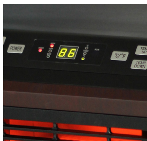
Programador de encendido y visor digital LED.